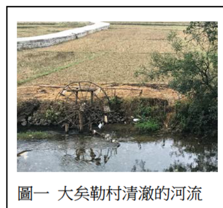
圖一 大矣勒村清澈的河流